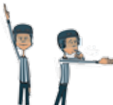
LE HORS-JEU Article 450